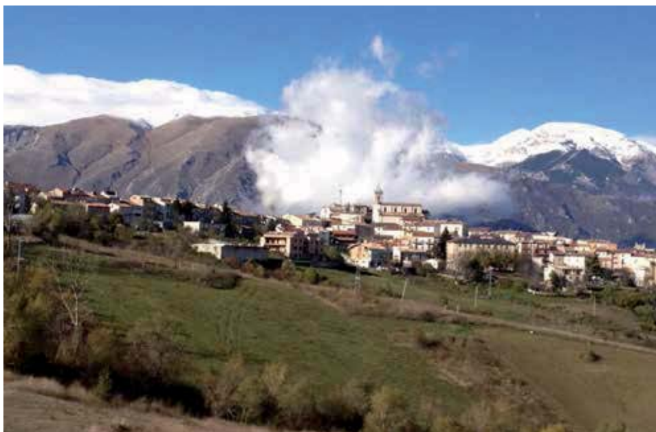
Là dove nascono le nuvole...

Ho sempre pensato che non c'è una scelta migliore delle altre e che tutte sono ugualmente rispettabili, non ho preferenze,