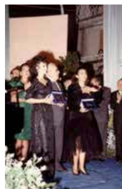
1992 - 2° Concorso internazionale per giovani voci liriche Torricella a Vincenzo Bellini. Premiazione

trascorso può affievolire e poi cancellare la memoria di questo legame tra Bellini e Torricella. Allora affinché quel seme non muoia perchè l'amministrazione comunale o la Pro loco non provano a rivitalizzare quel legame organizzando una serata Belliniana? Se la risposta è positiva noi faremo la nostra parte e daremo il nostro contributo fattivo.