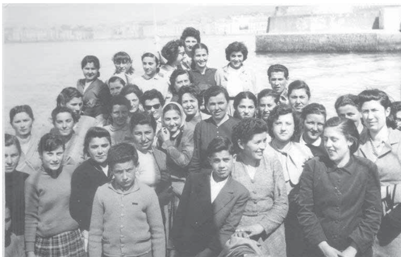
1956 - Gita a Sorrento