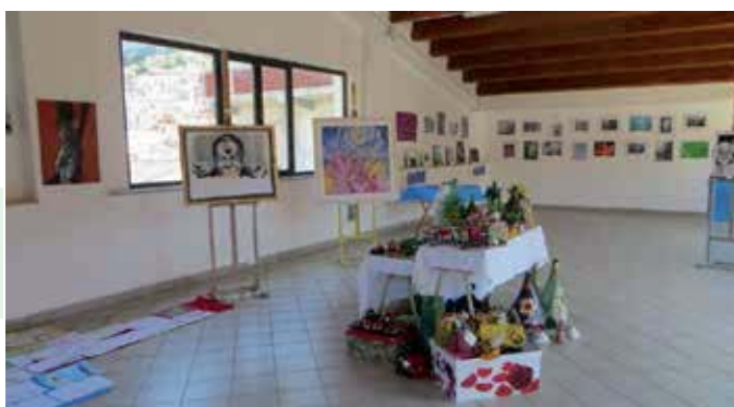
Pennadomo - Sala comunale, dove il 16 di agosto 2013 si è conclusa l'esposizione delle opere che hanno partecipato alla Transumanza Artistica 2013 e che ha visto vincitore l'artista Roberto Di Giampaolo