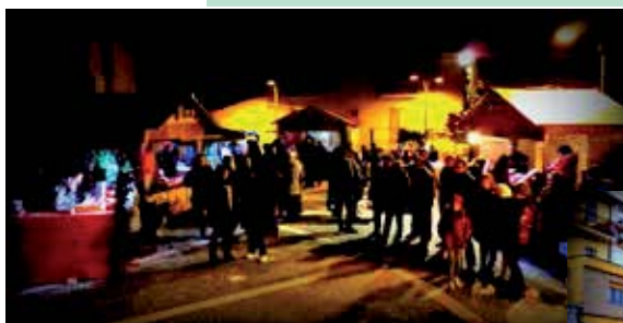
29 dicembre 2013 - Organizzato dall'Oratorio San Giacomo si è svolto il 1° Mercatino di Natale a Torricella in Piazzetta dell'Unità d'Italia

lucine colorate. Oltre a poter visionare ed acquistare i lavori degli artigiani della zona, era possibile partecipare alla pesca di beneficenza, degustare fritti, crepes alla nutella, vin brulé e cantucci e partecipare all'estrazione della lotteria. Il tutto accompagnato da musica di ragazzi di Tor-