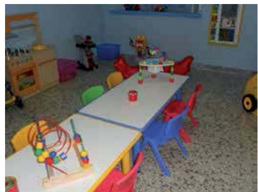
Una veduta della Tana degli Orsetti in Via Bellini a Torricella Peligna