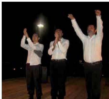
La Compagnia dei Guasconi durante la rappresentazione di "Banditen" il 6 di agosto 2011 in Pineta