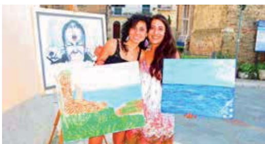
Agosto 2013 - Vasto - Tappa del transumanzartistica, due delle partecipanti alla gara