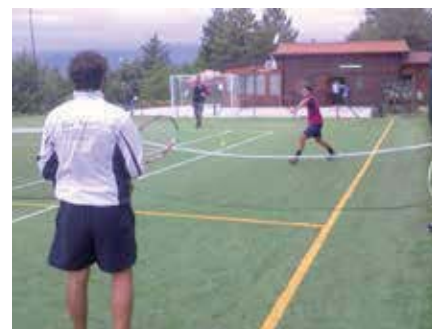
Lezioni di tennis per adulti presso i campi sportivi comunali adiacenti al Ristorante Da Ciro

e quando gli fa un bel punto gli dice, "hai visto che punto ti ho fatto"? A mio avviso