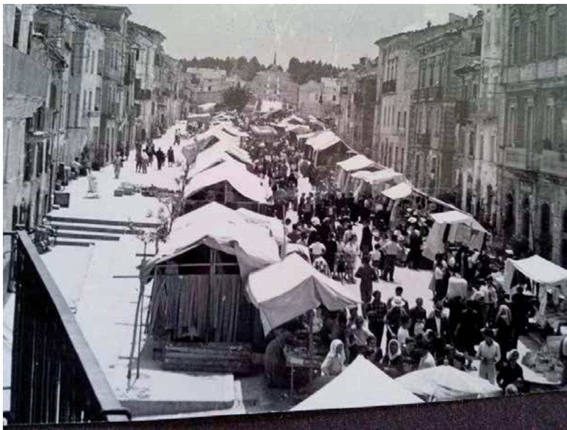
1952 - Fiera di San Marziale