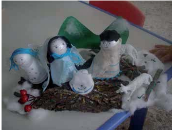
Uno dei primi lavori eseguiti dai bambini della Tana degli Orsetti di Torricella Peligna per le feste natalizie

La Tana degli Orsetti e' un luogo accogliente , pieno di affetti , dove poter accogliere tanti piccini: biondi, moricci e bircichini con le guance lisce come il velluto da coccolare, da imboccare, da giocare e da istruire. Un ambiente colorato di giallo, di verde, di rosso e di blu, con giostre, mattoncini, libricini, dove correre, saltare e ridere. Un luogo che offre protezione e sicurezza , amore e felicità', dove ogni bimbo possa sentirsi un essere speciale e ricevere sempre da noi un sorriso rassicurante.