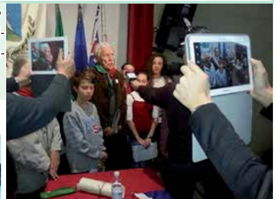
Il generale Jonathon Relay, vice comandante supremo della Nato fino al 2009 e comandante delle forze italiane in Iraq, in alta uniforme, presente alla commemorazione per conto dell'esercito inglese