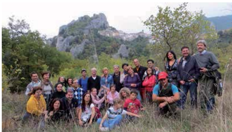
Una delle camminate artistiche e geologiche organizzate dall'associazione no profit presso le Gole di Pennadomo e Torricella Peligna, sito di interesse Comunitario