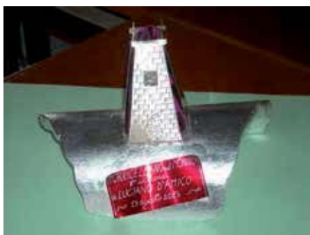
La torre in argento