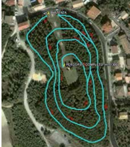
Veduta aerea della Pineta “Antonio Porreca”, con disegnati i probabili percorsi pedonali

Una pineta più vivibile garantisce obiettivi molto importanti per i fruitori, ad esempio un utilizzo migliore e di tutto lo spazio della pineta stessa; offre la possibilità agli utenti di un utilizzo attivo del proprio tempo; li aiuta ad essere consapevoli dell’importanza e dell’utilità di una attività fisica, superando in questo modo l’abitudine diffusa, specie tra gli anziani, di stare passivamente seduti; li rende socialmente più inclini a contatti con gli altri oltre che a ritrovare se stessi, stimolando in questo modo le potenzialità psichiche e fisiche. In conclusione non si chiede all’Amministrazione di stravolgere l’equilibrio ambientale della pineta e tanto meno attuare interventi di sbancamento o di disboscamento incontrollato, ma semplici interventi che possano in un primo momento consentire di creare percorsi pedonali tra gli alberi, e poi magari, una volta in possesso di un finanziamento, migliorare lo stesso con l’inserimento di attrezzature, panchine, punti di sosta, illuminazione (perché non sfruttando l’energia solare).