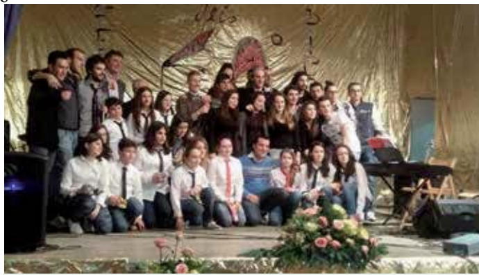
Gli organizzatori del festival 2014, il festival del cinquantenario. Presentatori, coro e orchestrina,