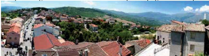
Toricella dal campanile