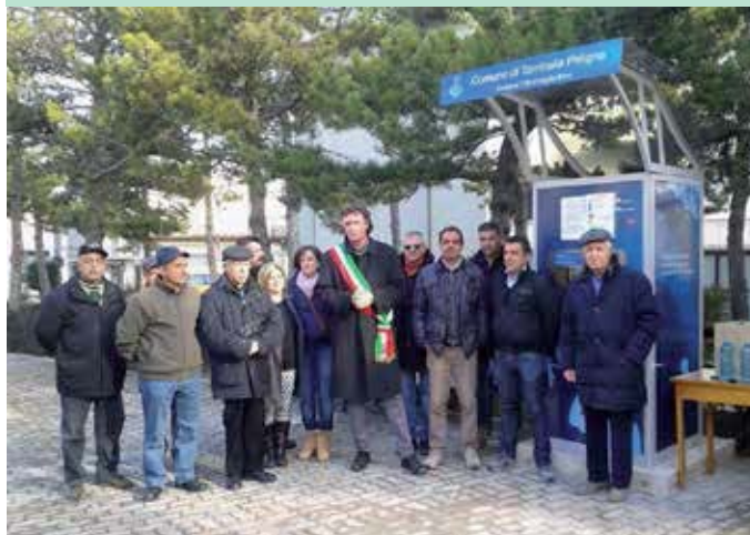
Torricella Peligna 21 dicembre 2013 - Cerimonia di inaugurazione della Fontana TVB

Anche Torricella ha l'acqua depurata a basso prezzo, a Km zero e con abbattimento del consumo di plastica