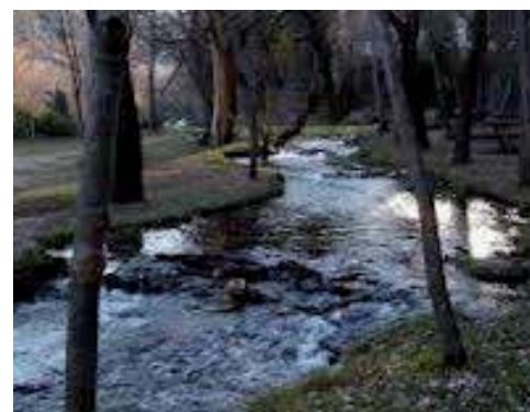
Parco delle Acquevive - Un tratto del parco ristrutturato nel 2012 dove si può passeggiare ed ammirare varie specie botaniche

Il Parco fluviale delle Acquevive, sulle due sponde del fiume Aventino, dove è presente la Sorgente delle Acquevive, è assolutamente uno dei posti d'Abruzzo da non perdere.