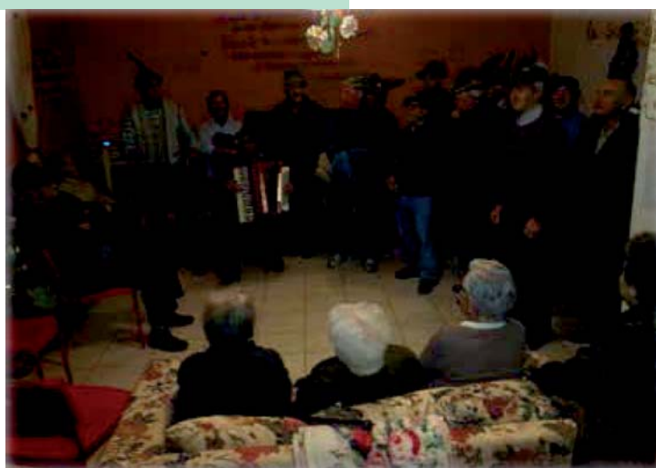
Sopra la visita degli alpini presso la casa di riposo CASA TUA A sinistra il cenone degli anziani al ristorante Il Paradiso

na "L'allegria compagnia". Nei giorni successivi una delegazione con il sindaco è andata a fare visita ed intrattenersi con tutti quegli anziani soli e che fanno fatica a uscire di casa. Infine, una novità quest'anno, insieme agli Alpini sono andati fare visita alla