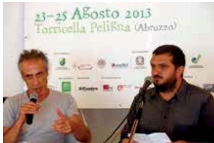
Marco Vichi, scrittore, intervistato da Alessio Romano ( a destra)

Domenica pomeriggio, ultimi appuntamenti con il Festival 2013. Grande attesa per uno dei narratori più interessanti nel contemporaneo panorama letterario italiano. Casual e cordiale, Marco Vichi parla dei suoi libri, del nostro Fante, di poesia. E il tempo vola, tra letteratura e... musica. L'incontro si conclude con la presentazione, sobria e commossa a un tempo, di un piccolo libro di versi scritti da Paola Cannas, madre dell'autore.