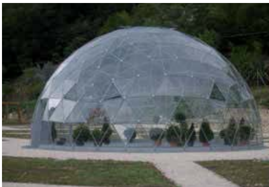
Parco delle Acquevive- La bellissima cupola geodetica ad altissima efficienza energetica dove vengono coltivate e preservate varie essenze locali

chino questo scempio e non si arrivi a buttarne all'aria tanti soldi già spesi e una vera risorsa per la intera zona interna del Sangro Aventino. (AP)