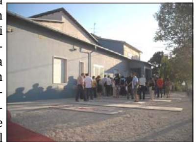
La mediateca il giorno dell'inaugurazione

Sicuramente il Festival Letterario resterà l'evento principale che si svolgerà nella Mediateca, inoltre è già in corso il trasferimento dei libri della Biblioteca Comunale affinché si possa avere nella Mediateca un flusso di presenze costanti. Abbiamo avuto contatti con le scuole locali che sono molte interessate al suo utilizzo, sia come Biblioteca-Mediateca sia come sala conferenze.