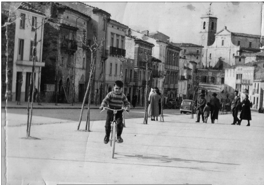
Corso Umberto I - 1955

corridore toscano contribuì a stemperare il clima di odio e di risentimenti tra gli Italiani. Cosa c'entra tutto questo discorso con un semplice gioco delle stagnaròle in voga tra i ragazzini torricellani negli anni '50? Lo vedremo più in là. Adesso vorrei soffermarmi brevemente su Gino Bartali e il suo eterno rivale Fausto Coppi, due grandi campioni di quei tempi, il primo vinse tre Giri d'Italia e due Tour de France, il secondo, cinque Giri e due Tour, oltre a numerose classiche. Bartali aveva la faccia da pugile, molto loquace; è rimasto famoso il suo motto che ripeteva spesso con l'inconfondibile accento toscano: "l'è tutto sbagliato, l'è tutto da rifare". Coppi, piemontese, era schivo, timido e taciturno. Gli Italiani, seguendo l'andazzo ereditato dal passato e cioè quello di dividere qualsiasi città o piccolo borgo in due fazioni contrapposte e in eterna lotta fra loro, vedi Guelfi e Ghibellini, Democristiani e Comunisti, pensarono bene anche quella volta di schierarsi chi per Coppi e chi per Bartali. Grazie ai due fuoriclasse, il ciclismo divenne popolare quasi quanto il calcio, tanto che, come abbiamo potuto constatare, contribuì a sedare una incipiente e pericolosa rivolta. Bisogna aggiungere però che influenzò anche il cosiddetto gioco