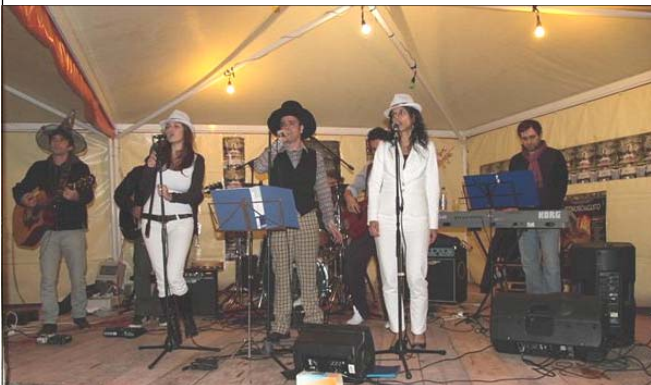
Il gruppo cover di Rino Gaetano "Dominique las bas....."

tradizioni e alla buona musica!! Un lavoro ben fatto, avvio di altre serate come questa, mai uguali perché l'esperienza insegna a non aspettarci la solita "zolfà", dato che l'organizzazione si va migliorando e soprattutto si spera che sempre più numerosi si intervenga in essa e per essa, per il futuro del nostro territorio!! Decisi a fare IL MEGLIO DEL MEGLIO NEL MEGLIO!!!!!!