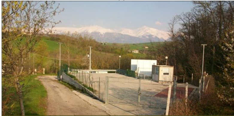
Il centro di trasferimento dei RSU situato in contrada Colle Zingaro