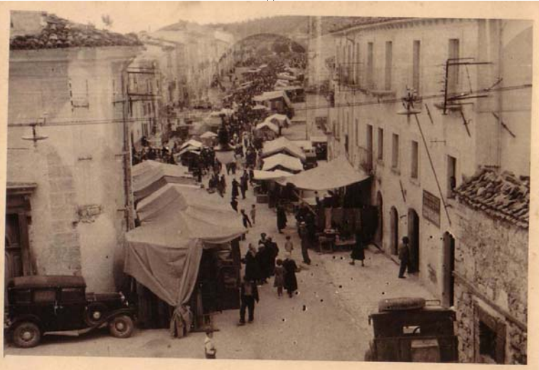
Corso Umberto I — La fiera— 1943