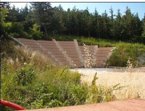
Il teatro all'aperto dietro la pineta

Nell'ambito della manutenzione e ripulitura annuale della pineta è stato sempre ripulito anche l'anfiteatro, quest'anno abbiamo anche cercato di aprire un varco affinché fosse più accessibile dalla