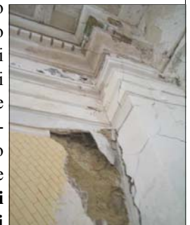
Muro della navata di destra molto danneggiato

sta a significare che ogni lavoro, ogni spostamento di una mattonella deve avere il benestare della Soprintendenza. Avuta questa approvazione si partì con la ristrutturazione del tetto. Pian piano che si andava avanti però venivano fuori altri lavori ed altre "magagne" della ristrutturazione precedente. Si scoprì la causa dell'umidità dell'abside, dovuta alla cattiva chiusura di un rosone ad un'altezza di 12 mt. Una specie di finestra posizionata sulla volta dell'abside che permetteva l'entrata della pioggia e della neve e quindi provocando l'ammaloramento e il crollo della parete interna della doppia calotta. In questi giorni si sta sistemando lo scollamento fra la facciata in pietra